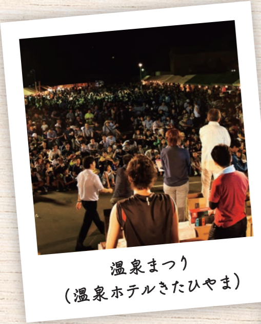
温泉まつり (温泉ホテルきたひやま)