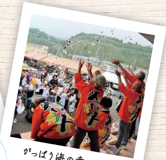
がっばり海の幸フェスタ in わっためがして大成

大成区・久遠漁港で開催される、 せたな町の「食」を味わえるお祭り。 「ひらめのつかみ取り」やアワビとお餅を 一緒にまく「あわびもちまき」など、 海の幸たっぷりの大成区ならではの 珍しい催しが大人気。