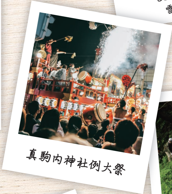
真駒内神社例大祭