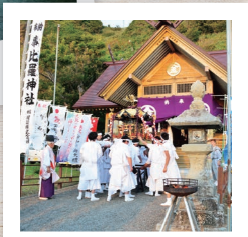
事比羅神社例大祭