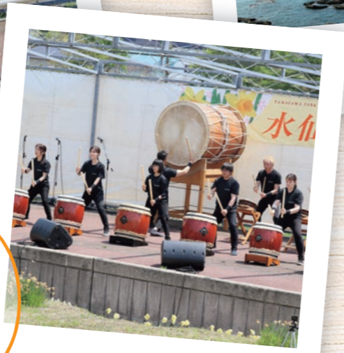
玉川公園水仙まつり

町花である「水仙」が 約30種・約30万株咲き誇る 玉川公園を会場に行われている春の祭り。 桜の開花時期が重なると、 水仙との美しいコントラストを 楽しむことができる。