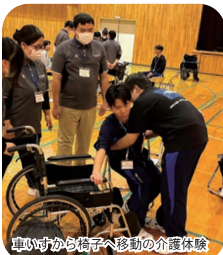
車いすから椅子へ移動の介護体験