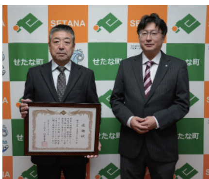
【株】高橋建設せたな本店 町道川尻線・栽培センター通り線草刈

これは、地域貢献活動の一環として両社が毎年行っているもので、株式会社高橋建設せたな本店は町道川尻線・栽培センター通り線草刈と国道229号沿い瀬棚区内植樹帯整備を、北海道ロードメンテナンス株式会社は北檜山区排水路清掃に対して贈呈したものです。