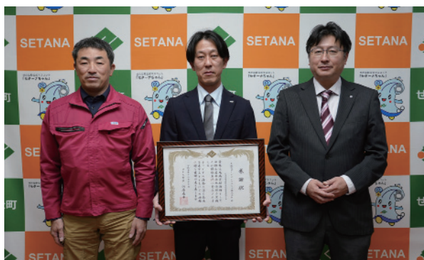
【北海道ロードメンテナンス（株）】 北檜山区排水路清掃