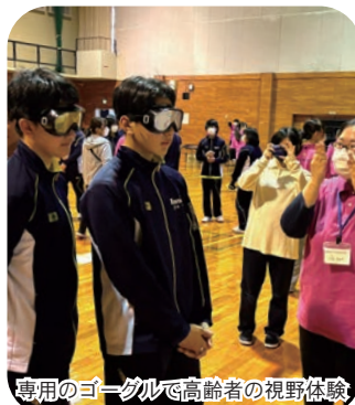
専用のゴーグルで高齢者の視野体験

11月6日（木）檜山北高等学校2年生、7日（金）北檜山中学校でせたな町と今金町の中学2年生を対象に、北海道介護福祉学校による出前授業が開催されました。