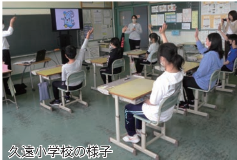
久遠小学校の様子