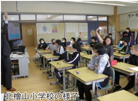
北檜山小学校の様子

6月5日(月)、久遠小学校で5・6年生、6月15日(木)北檜山小学校で6年生を対象に租税教室が開催されました。