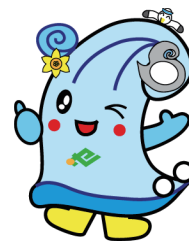
ゼロカーボンせたな公式ロゴマーク