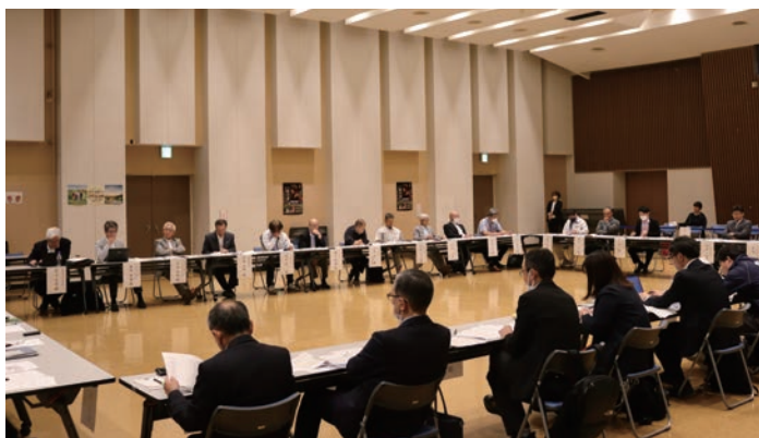
せたな町ホームページ ゼロカーボン推進協議会開催状況 https://www.town.setana.lg.jp/industry/post_1640.html