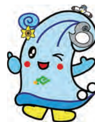
ゼロカーボンせたな公式ロゴマーク