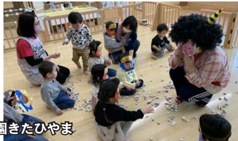
認定こども園きたひやま

節分の2月3日(木)、町内の園児が豆まきを行いました。 認定こども園では、新型コロナウイルス感染症対策のため、クラスごとに行われました。 節分について勉強した後、登場した鬼に泣き出してしまいう子もいましたが、みんな力で合わせて鬼を退治しました。 大成保育園では、本来の豆まきは大豆を使って行われることを勉強した後、ボールで鬼退治を、瀬棚保育所では、本格的に炒った大豆を使用し、年少組が見守る中、鬼を退治して