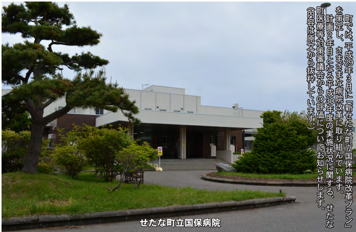
せたな町立国保病院

町では、平成29年3月に「新せたな町立国保病院改革プラン」を策定し、さまざまな病院改革に取り組んでいます。計画2年目となる平成30年度の実施状況に関する、せたな町医療等対策審議会からの評価についてお知らせします。 〔内容は原文から抜粋しています。〕