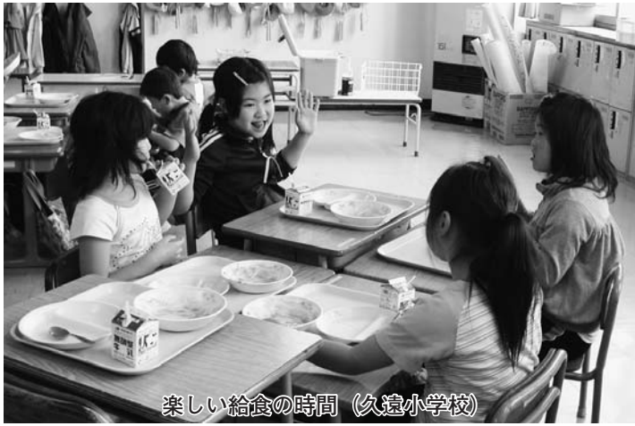
楽しい給食の時間 (久遠小学校)

であることを踏まえ平成20年から各学校で取り組みよう指導していききたいと思います。地産地消については学校給食の地場産物を使用することは児童生徒が郷土に関心を深め、地域の生産活動について学ぶなどの教育効果が期待できるなど意義あるものと考えています。