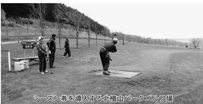
シーズン券を導入する北檜山パークゴルフ場