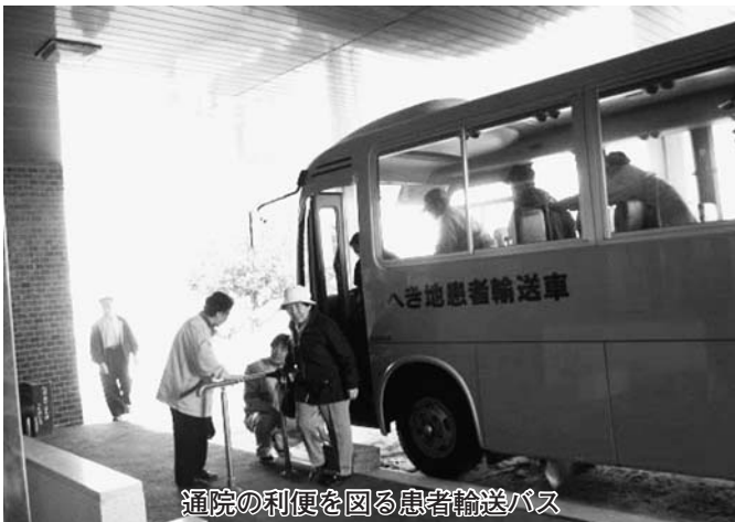
通院の利便を図る患者輸送バス

はり・きゅうの関係については、医師の指示が必要であり、定例会終了後医師と協議して方向性を出すことにしていますが、住民の関心を頭にに入れて行動したいと思えます。