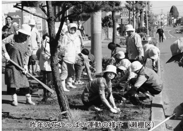
昨年の花いっぱい運動の様子（瀬棚区）

一⑤簡易焼却炉は構造基準を満たさないため、ダイオキシン汚染や有害物質発生など大気汚染となることから使用禁止となり、昨年7月に簡易焼却炉の処分を町民に周知したところ、処分依頼は5件でありましたが4回の啓発活動の結果、以前よりごみ焼却