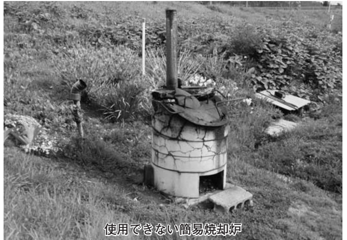
使用できない簡易焼却炉

していると思つています。町の広報活動とマスコミ報道を考慮したとき、町民の意識が一層深まって、こうした環境問題に自らから取り組むという機運が高まることを願っています。