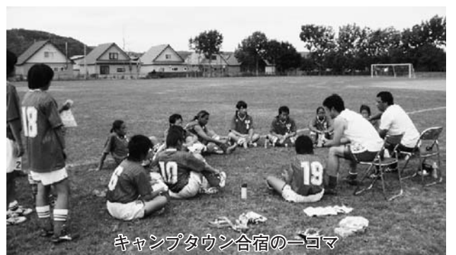
キャンプタウン合宿の→コマ

今日、食育が大きな国民的課題となっており成長期にある子供たちへの食育教育は食の大切さを理解し生涯を通じて健康で活力ある生活をおくるための基礎を身につけることを目的とし将来を担う子供たちの健康教育の一環として重要と認識しております。そのため子供たちへの食に関する指導を充実し望ましい食習慣の形成を促すことが大切