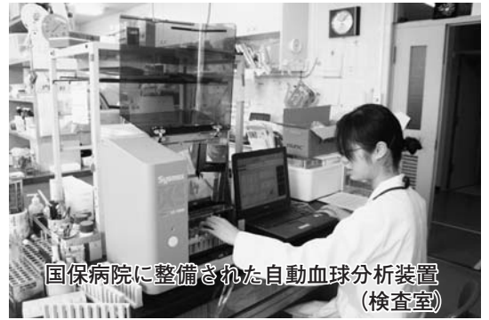
国保病院に整備された自動血球分析装置(検査室)