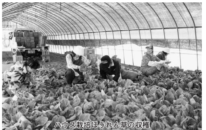
ハウス栽培ほうれん草の収穫

本町では約1億5900万円になると思います。これはあくまでも交付税であり、使途を特定しての補助金とは異なり、町全体として