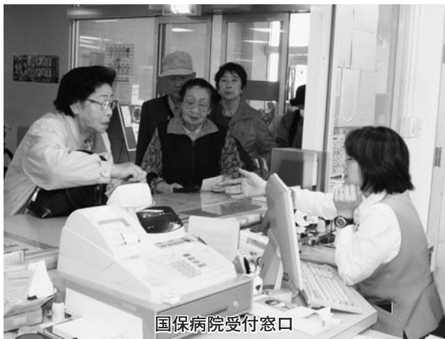
国保病院受付窓口

健保の扶養者を含め、加入者の約8割が軽減措置の対象者と見込まれており、健康診査も、広域連合から町が委託を受けて行います。本年度開始する制度であり、町独自の対応策は、医療給付実績や保険料の収納状況及び、管内市町村の動向を見きわめながら総合的に検討いたします。