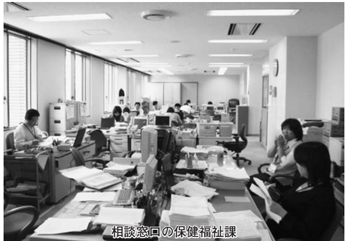
相談窓口の保健福祉課

そこで今、町としてできることは、苦しんでいる人、困っている人の声をしっかりと取り、具体的な支援ができる対応が必要と考えますが、町長の見解をお聞かせください。