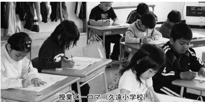
授業の一コマ (久遠小学校)

とであるが、応用力を高める学習事業はせきたな町独自で取り組んでいかなければならないと思います。19年度文科省が全国で行っている理科支援員等配置事業という事業に、せきたな町は参加しているのか？ 今後の見通しは？