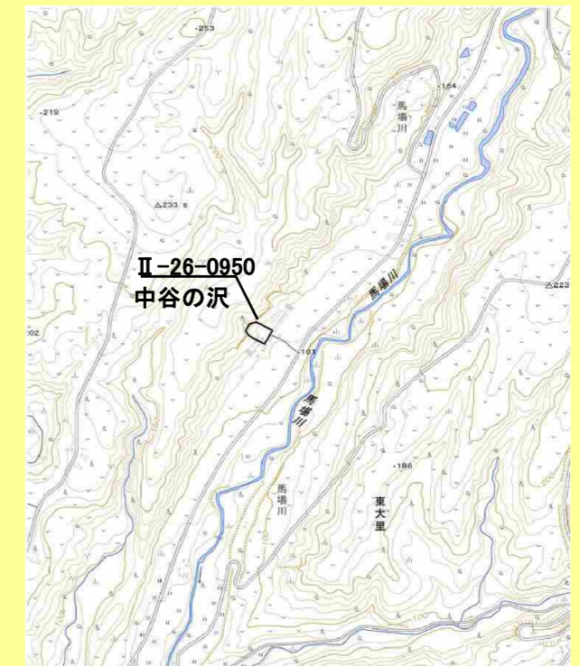
位置図(図の上位が北を示す)