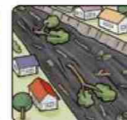
川の流が濁り流水が混ざりはじめる