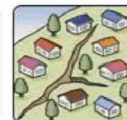
地面にひび割れができる