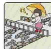
雨が降り続けているのに川の水位が下がる