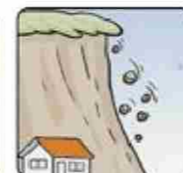
小石がバラバラ落ちてくる