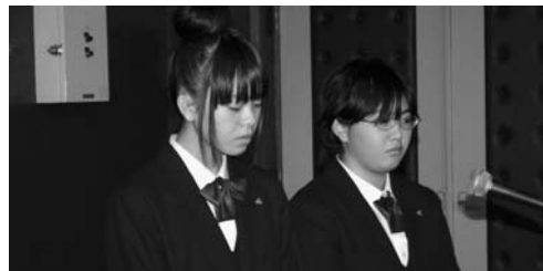
アメリカのファッションスタイルについて、調査した内容を報告。(写真：左) 報告会は生徒が司会進行。落ち着いていて感心しました。(写真：右)