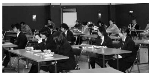
会場では、一般の参加者や生徒たちが熱心に聞き入っていました。