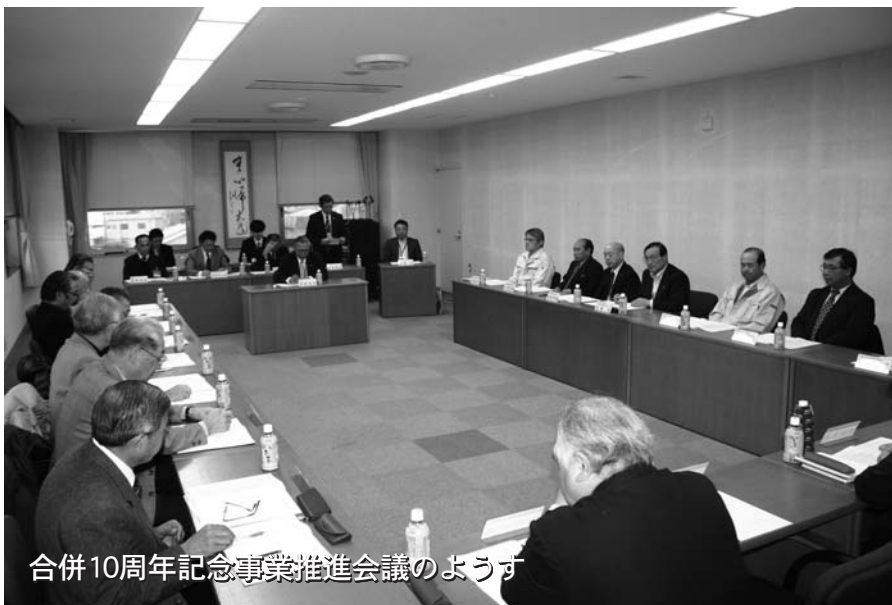
合併10周年記念事業推進会議の様子

来年、平成27年9月1日、せたな町が誕生して10周年を迎えます。町ではこの節目にあたり、将来に向かって更なる飛躍と、一層の一体感の醸成を目指し、広く町民の皆さんからの提案などを取り入れた各種記念事業などを展開します。