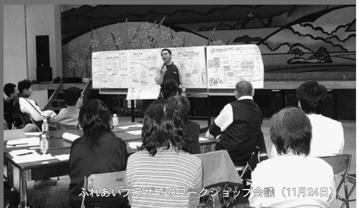
ふれあいプラザでのワークショップ会議（11月24日）

せたな町の資源を活用した「地産地消」をテーマに行政・商工会・町民と連携したソフトを動かすプロデュース集団（TMO）を設置します。 皆さまのご理解とご支援をよろしくお願いいたします。