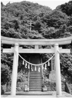
太田神社本殿へ続く鳥居

探検家「松浦武四郎」は太田神社を参拝した際「オニカミノボリ」と手記に残し、まさに「鬼が神のように登る」という意味で、その険しい道のりを表現しています。