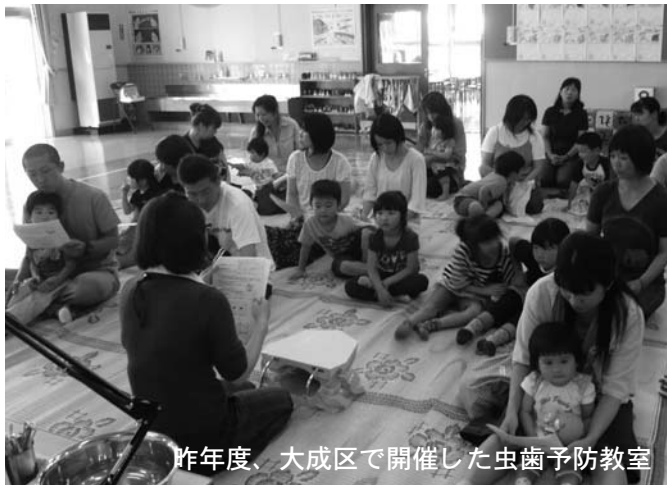
昨年度、大成区で開催した虫歯予防教室