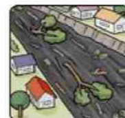
川の流が濁り流水が混ざりはじめる