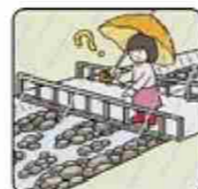
雨が降り続けているのに川の水位が下がる