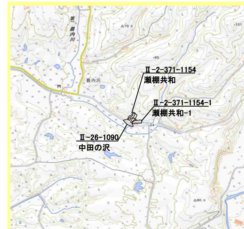
位置図(図の上位が北を示す)