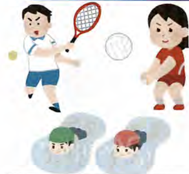
テニス、バレーボール、水泳 6.0メッツ

雪かきはテニスや水泳と同じくらいの運動強度があり、なかなか外に出づらい冬でのいい運動になります。しかし心臓への負担もかかる為、「 通常的心拍数の+30拍 」や「 約30分ごとに休憩を入れる 」など無理のない「 ややきつい 」程度の仕事量で行ってみましょう。