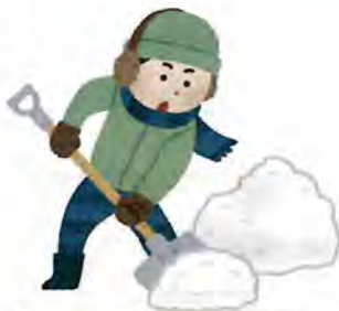
スコップで雪かき 6.0メッツ