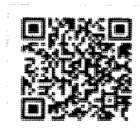
せたな町 ホームページ