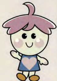
マスコットキャラクター あんちゃん