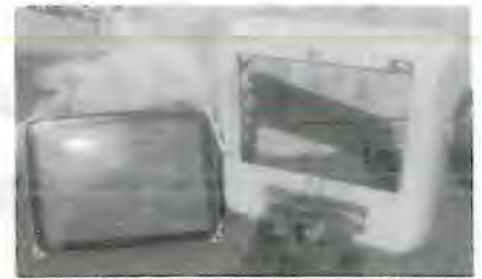
組合指定の不燃物ごみ袋に入れられていた小型テレビ

また、破壊したり自由解体されたものであっても「ごみ」としては扱えないので北部檜山衛生センター組合で受入れ処分することはできませんのでご注意ください。