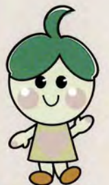
マスコットキャラクター しんちゃん