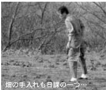
畑の手入れも日課の一つ…

そのほか、散歩をしたりロビーで懇談したり、温泉に行ったりと、皆さん有意義な生活を送られているようです。