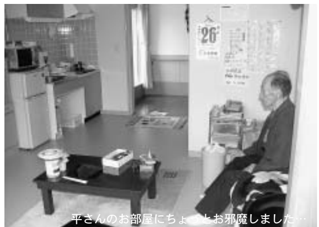
平さんのお部屋にちょっとお邪魔しました…