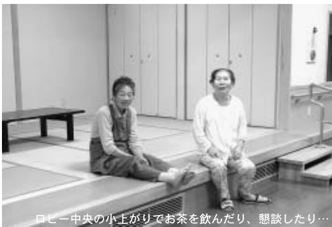
ロビー中央の小上がりでお茶を飲んだり、懇談したり…