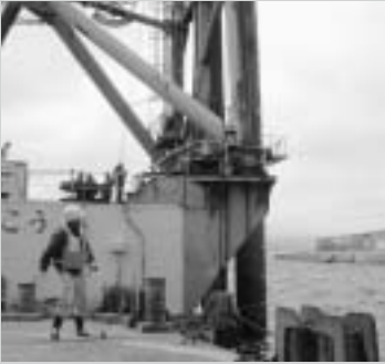
土台を設置するためのくい打ち