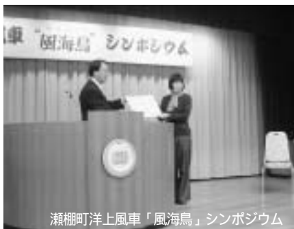
瀬棚町洋上風車「風海鳥」シンポジウム

現在は、平成16年4月の本格的な運転に向け試験運転を行っています。また、シンボルとなるロゴとあわせて愛称も「風海鳥」（かざみどり）と決まり、平成15年11月10日にはシンポジウムが開催されました。