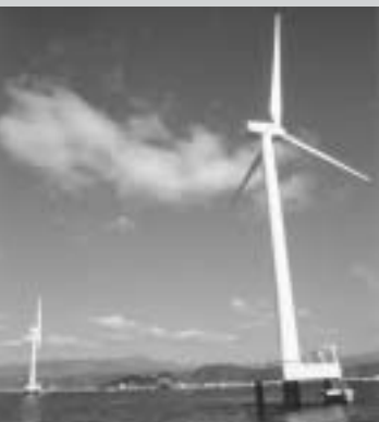
ついに2基の洋上風車が完成