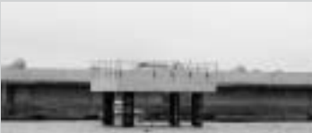
土台が完成。この上に風車を設置