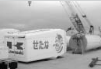
ぞくぞくと風車の部品が搬入