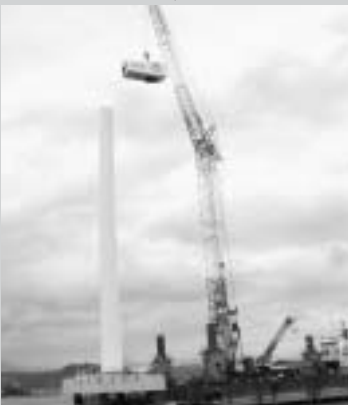
風車を慎重に組み立て