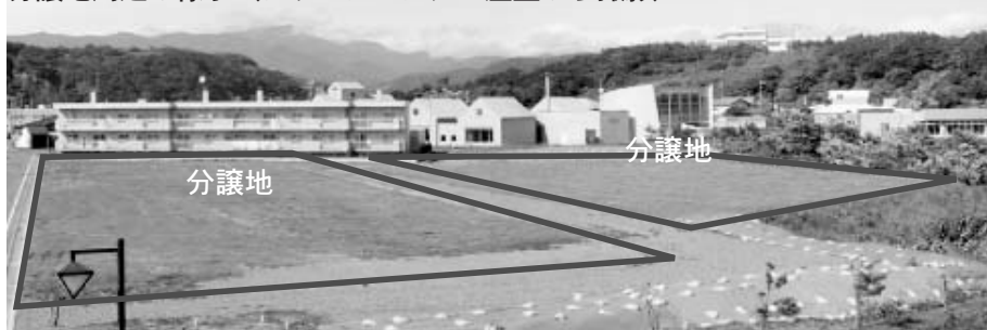
分譲地周辺の様子（クリーンセンター屋上から撮影）