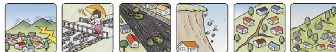
山鳴りがする 雨が降り続けているのに川の水位が下がる 川の流れが濁り流水が混ざりはじめる 小石がバラバラ落ちてくる 地面にひび割れができる 斜面から水がふき出す

次のような現象を察知した場合は、土砂災害が直後に起こる可能性があります。直ちに周りの人と安全な場所へ避難するとともに、関係機関へ通報してください。