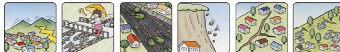
山鳴りがする 雨が降り続けているのに川の水位が下がる 川の流れが濁り流水が混ざりはじめる 小石がバラバラ落ちてくる 地面にひび割れができる 斜面から水がふき出す

次のような現象を察知した場合は、土砂災害が直後に起こる可能性があります。直ちに周りの人と安全な場所へ避難するとともに、関係機関へ通報してください。