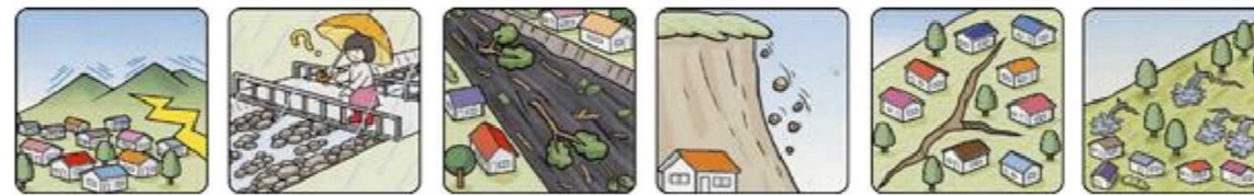
山鳴りがする 雨が降り続けているのに川の水位が下がる 川の流が濁り流水が混ざりはじめる 小石がバラバラ落ちてくる 地面にひび割れができる 斜面から水がふき出す

次のような現象を察知した場合は、土砂災害が直後に起こる可能性があります。直ちに周りの人と安全な場所へ避難するとともに、関係機関へ通報してください。