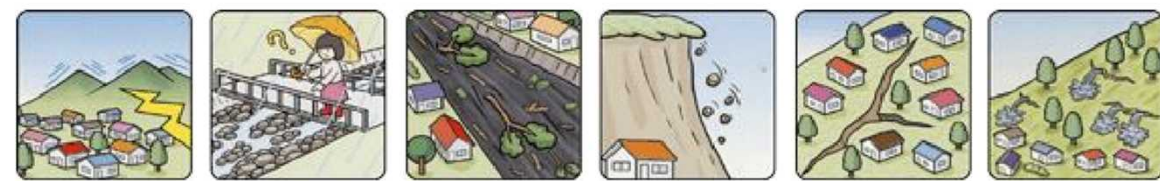
山鳴りがする 雨が降り続けているのに川の水位が下がる 川の流れが濁り流水が混ざりはじめる 小石がバラバラ落ちてくる 地面にひび割れができる 斜面から水がふき出す

次のような現象を察知した場合は、土砂災害が直後に起こる可能性があります。直ちに周りの人と安全な場所へ避難するとともに、関係機関へ通報してください。