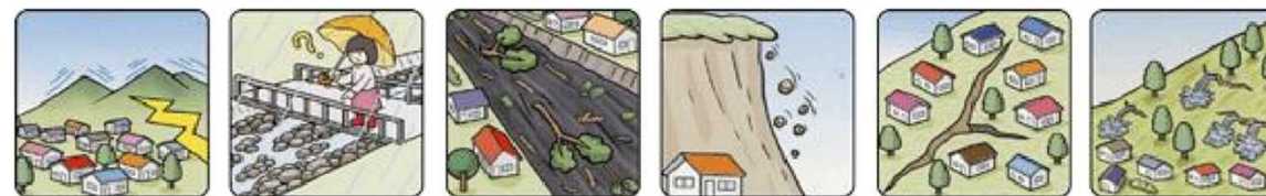
山鳴りがする 雨が降り続けているのに川の水位が下がる 川の流れが濁り流水が混ざりはじめる 小石がバラバラ落ちてくる 地面にひび割れができる 斜面から水がふき出す

次のような現象を察知した場合は、土砂災害が直後に起こる可能性があります。直ちに周りの人と安全な場所へ避難するとともに、関係機関へ通報してください。