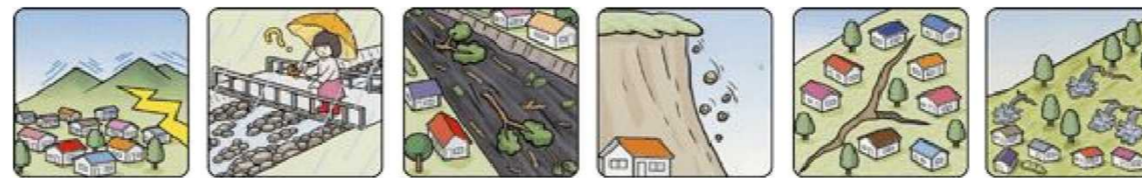
山鳴りがする 雨が降り続けているのに川の水位が下がる 川の流れが濁り流水が混ざりはじめる 小石がバラバラ落ちてくる 地面にひび割れができる 斜面から水がふき出す

次のような現象を察知した場合は、土砂災害が直後に起こる可能性があります。直ちに周りの人と安全な場所へ避難するとともに、関係機関へ通報してください。