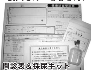
問診表&採尿キット