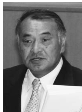
江上 恭 司 議員