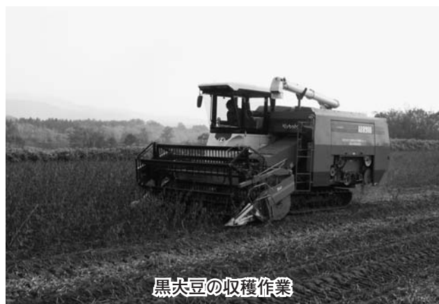
黒大豆の収穫作業

生産と消費の拡大を強化していく事が総合的に自給率を高める大きな施策の柱になると考えます。当町は農業、漁業の町です。地場産品がたくさんあります。地元で獲れた