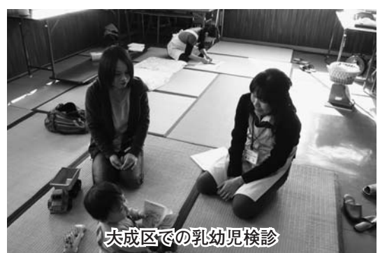
大成区での乳幼児検診

乳幼児健康診査実施の対象 年齢は0歳、1歳半、3歳と なっており、その後は就学前 の検診、3歳児検診から就学 前検診までのあき過ぎは、近 年増加している発達障害にと って重要な意味を持っていま す。発達障害は早期発見、早 期療育の開始が重要で5歳程 度になると検診で発見するこ とができるのですが、就学前 検診で発見されたのでは遅い