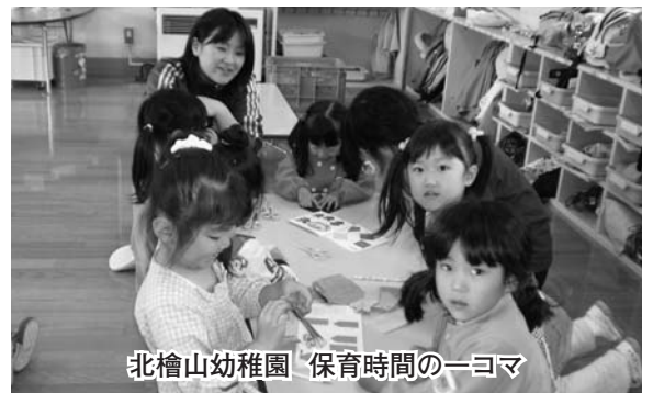
北檜山幼稚園 保育時間の一コマ

せたな町においては、現在保育所は3区に設置されておりますが幼稚園については北檜山区にしかございません。