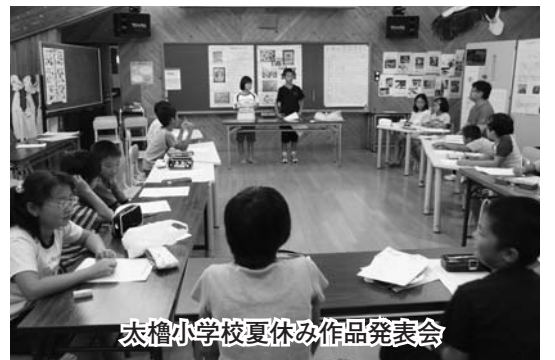
太槽小学校夏休み作品展発表会

①工夫とか改善に努めるといった抽象的な内容ではなく、目標数値や具体的手法、行動を明示した改善案ないし計画が策定されたのか。