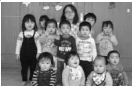
瀬棚保育所0歳児と1歳児「つくし組」の担任です。「一番小さいクラスでは、とにかく愛情をいっぱいそそいで接することが大事なことです。」

なって、地元で就職したいと思っていました。今思うと、保育所に通っていたころの先生にあこがれてたんだと思います。よく先生の真似をしていました。おせっかいな子供でしたよ。この夢は小学生の頃の文集にも書いていたくらいです。