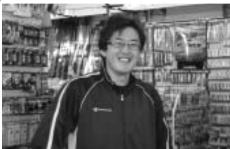
さびすのホームページとブログ見てください！「高校で習った情報処理が役立ちました。でも、「もうちょっと真面目に勉強しておけばよかったかな…」が本音と

スポーツが好きで、水曜日は仲間と体育館に集まります。みんな仕事をしているので毎週とはいきませんが、フットサル、バレーボール・バドミントン、いろいろなスポーツで町民大会に参加することを目標に楽しくやっています。20代前半〜30代後半までの17人の仲間です。今は大成区の駅伝大会に出よう