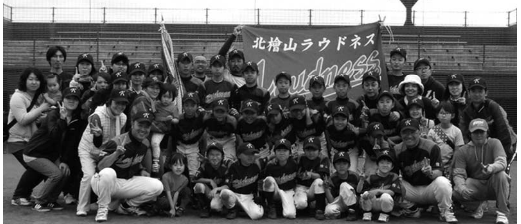
北檜山ラウドネス

6月28日(土)、29日(日)江差町を会場に行われたホクレン旗争奪第32回北海道少年野球選手権大会 兼 スタルヒン杯争奪第35回全道スポーツ少年団軟式野球交流大会 兼 2014 FIGHERS ジュニア王座決定戦 檜山支部予選大会で、せたな町の少年野球チーム「北檜山ラウドネス」が優勝、「大成ベアーズ」が準