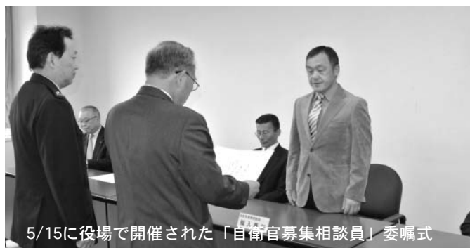
5/15に役場で開催された「自衛官募集相談員」委嘱式