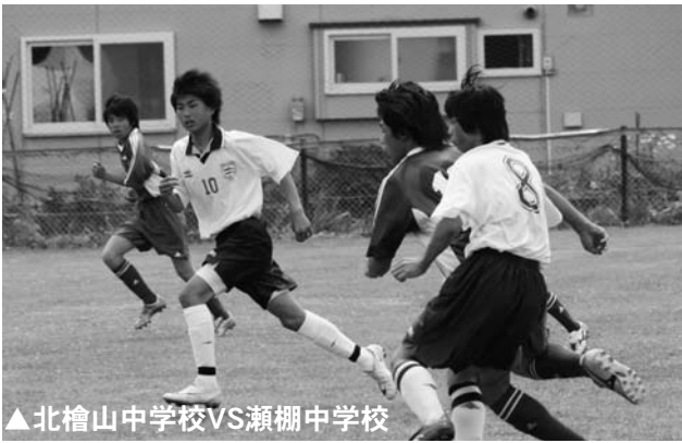
▲北檜山中学校VS瀬棚中学校

せたな町の参加種目は先に開催されている陸上のほか、球技6競技（バスケットボール、サッカー、バレーボール、卓球、バドミントン、軟式野球）と14日に開催された剣道で、生徒達は一生懸命頑張りました。