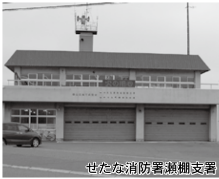
せたな消防署瀬棚支署