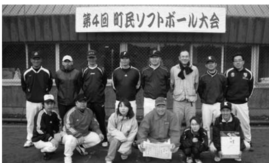
上 寿町宝寿山チーム