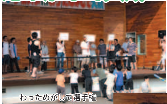
わっためがして選手権