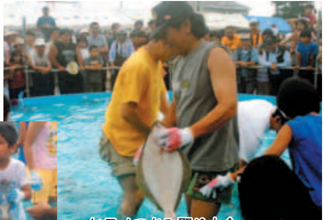
ヒラメつかみ取り大会