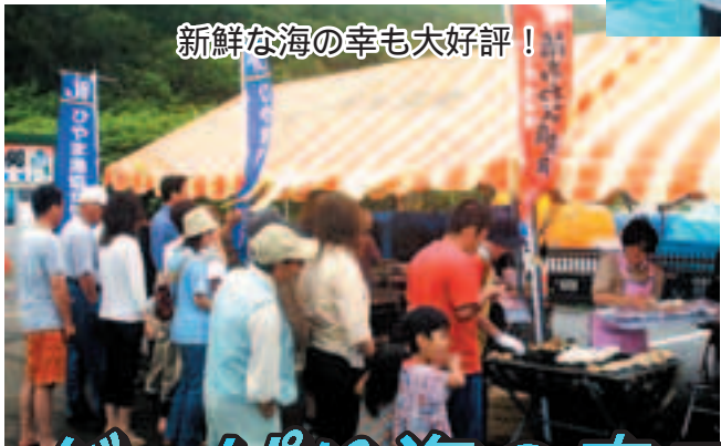
新鮮な海の幸も大好評！