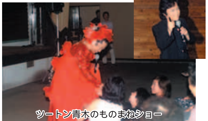
ツートン青木のものまねショー