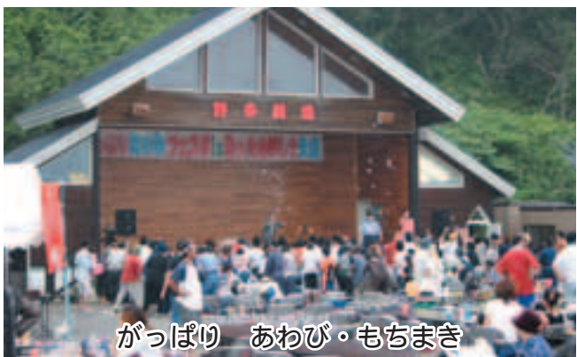
がっぱり あわび・もちまき