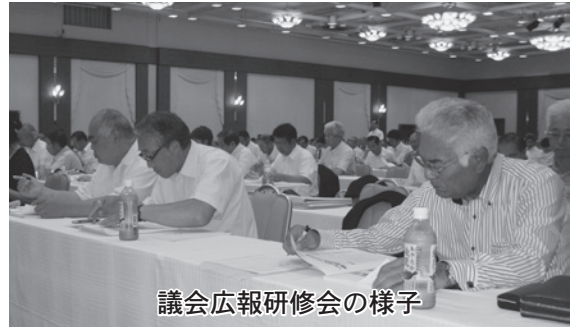
議会広報研修会の様子

今回の研修で学んだことを生かし、より読みやすく、簡潔でわかりやすい広報にすよう努力していきます。