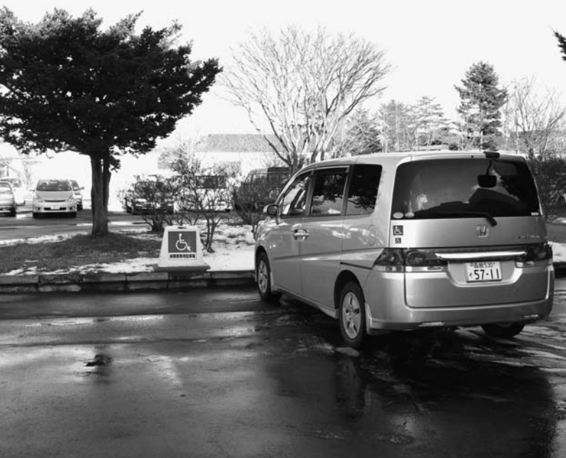
↑障害者専用駐車場（2台分）