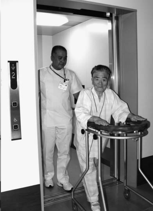
↑歩行器でエレベータを利用するようす