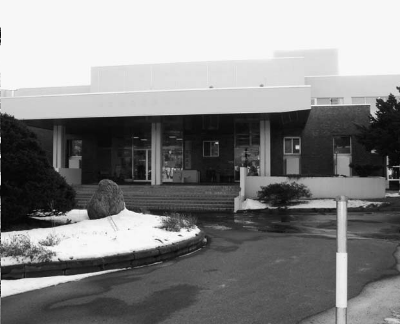
↑せたな町立国保病院外観