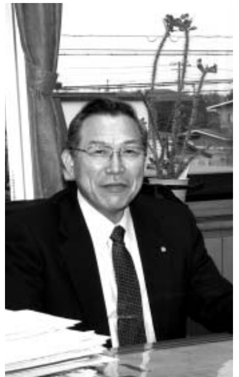
せたな町長 高橋 貞光