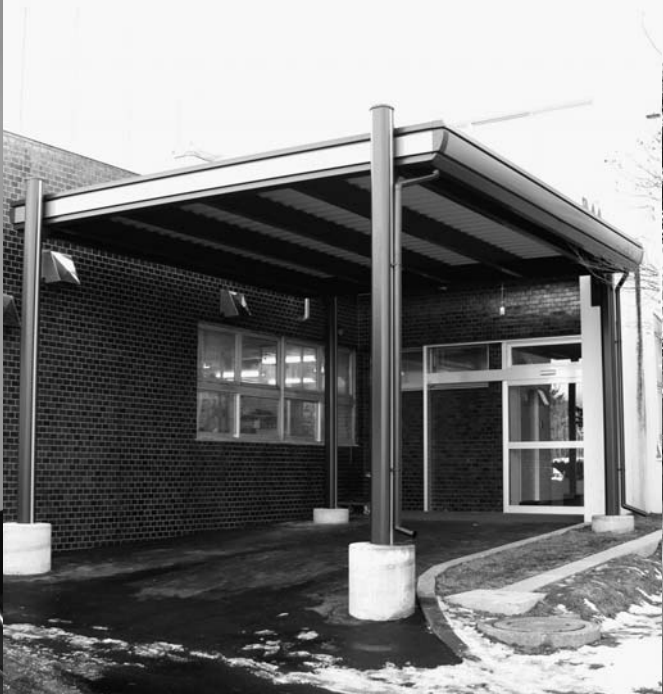
↑救急玄関には屋根を設置

せたな町立国保病院に待望のエレベータが完成しました。障害者専用駐車場から直結した、救急玄関には、カーポートも整備。屋根を設置したほか、バリアフリーで自動ドアになりました。