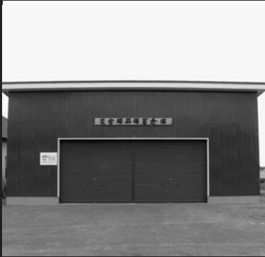
↑老人と母と子の家の横に整備された「災害備品備蓄倉庫」

このたび、(財)自治総合センターが実施する『平成17年度コミュニティ助成事業(宝くじ助成事業)』の『自主防災組織育成助成事業』による助成金の交付を受け、老人と母と子の家の横に『災害備品備蓄倉庫』が整備されました。この保管庫に、防災物品や土嚢などを一元的に管理することで、災害時の必要物品搬出など、迅速な対応が期待できます。