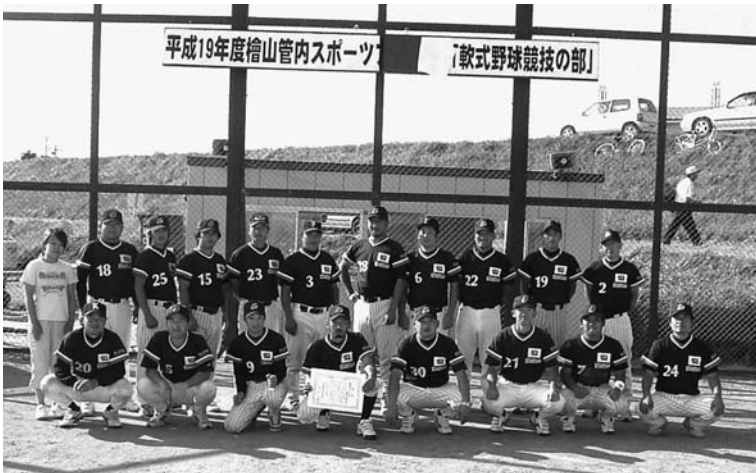
檜山管内スポーツフェスタ