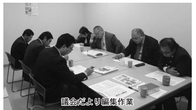
議会だより編集作業