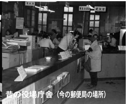
昔の役場庁舎 (今の郵便局の場所)