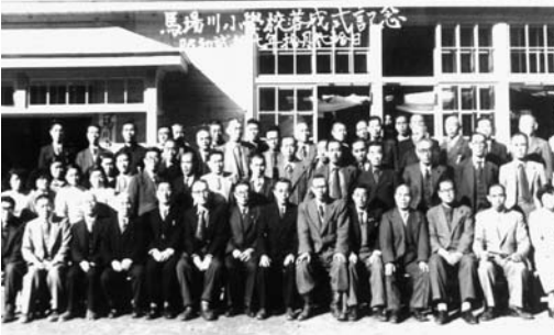
馬場川小学校落成記念