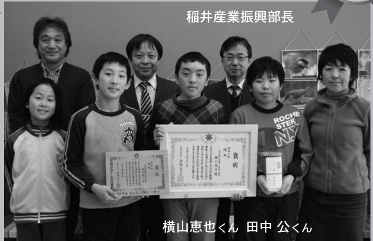
稲井産業振興部長