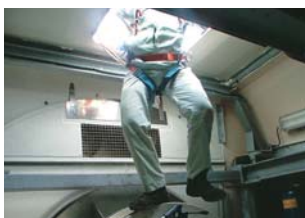
⑦ついに目指す頂上へ！風が強いので、微妙に揺れてます