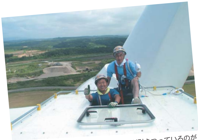
⑨せっかくなので記念撮影！二人とも顔が引きつっているのがお分かりでしょうか？それにしても高かった…。