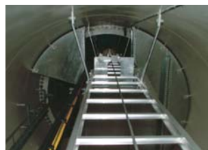
③このハンゴを約60mひたすら上がっていくことに…。