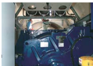
⑥20分ほどかけ、ようやくナセル（本体）部分に到着！