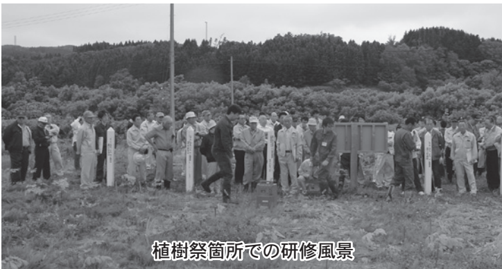
植樹祭箇所での研修風景

道南地区林活議連現地研修会が7月18日上ノ国町で行われ、せたな町からは6人の議員が参加しました。現地研修では上ノ国ダム周辺のヒノキ群落、上ノ国中学校グラウンド横の植樹祭箇所を視察しました。