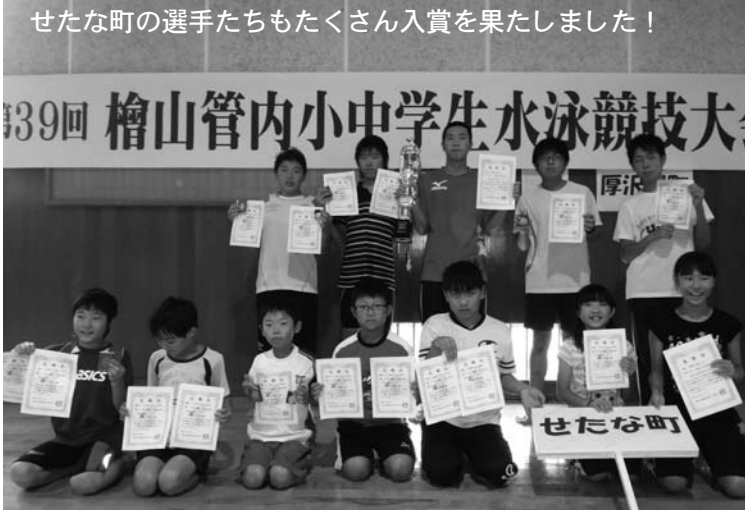
せたな町の選手たちもたくさん入賞を果たしました！