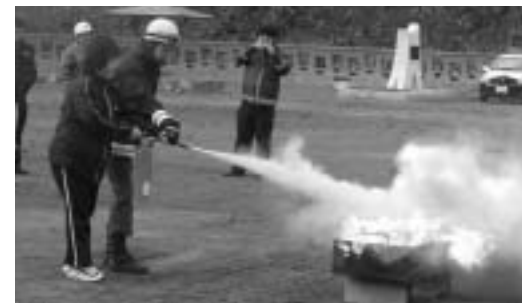
消火器を使っでの消火訓練の様子です。

島歌地区の住民をはじめ、せたな警察署、道南防災センターなどが参加し防災意識を高めるための訓練が行われました。災害が起きた時のための避難経路の確認や消火器を使って実際に消火する訓練を行いました。