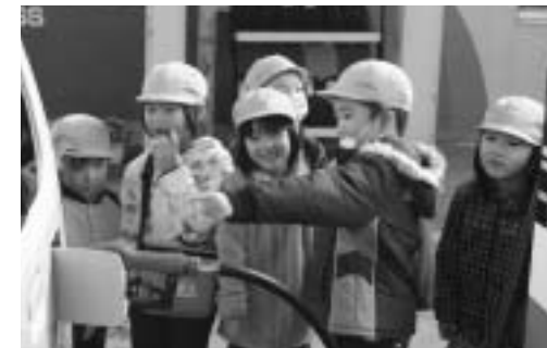
ガソリンスタンドの仕事を見学している様子です。

一生懸命働く皆さんに感謝の気持ちをこめて、手作りの壁掛けのプレゼントを贈りました。