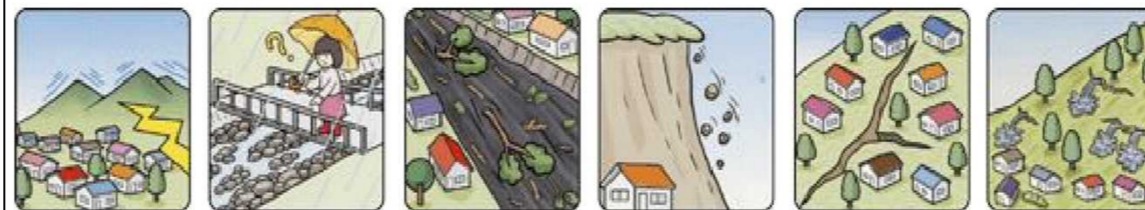
山鳴りがする 雨が降り続けているのに川の水位が下がる 川の流れが濁り流水が混ざりはじめる 小石がパラパラ落ちてくる 地面にひび割れができる 斜面から水がふき出す

次のような現象を察知した場合は、土砂災害が直後に起こる可能性があります。直ちに周りの人と安全な場所へ避難するとともに、関係機関へ通報してください。