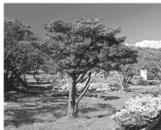
町の木「オンコ(イチイ)」