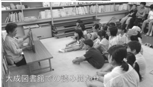
大成図書館での読み聞かせ

せたな町では、図書施設それぞれで工夫された図書の展示やイベントが催されています。図書館は静かに本を読む場所というイメージがありますが、現在は、趣味の本を用いたサークル活動の場としても活用されています。ぜひ、お近くの図書施設へ足を運んでみてください。