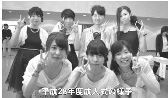
平成28年度成人式の様子

なお、本町出身者で進学、就職のため転出されている方も出席できますので、出席をご希望の方は最寄りの担当までご連絡ください。